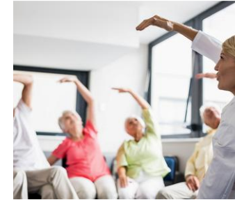
Résidence Mondéo Centre Ville