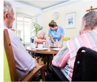
Résidence Moza La Ravine Blanche