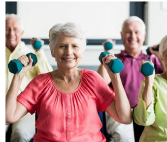
Résidence Tournesol Centre Ville