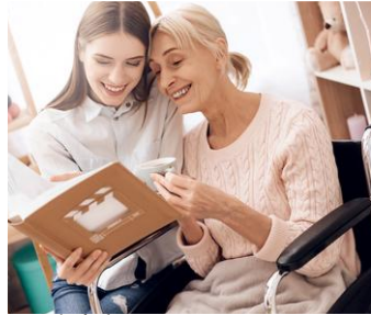
Résidences Les Oliviers Bois d'Olivés