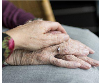
Résidence Les Charlottes Mont Vert