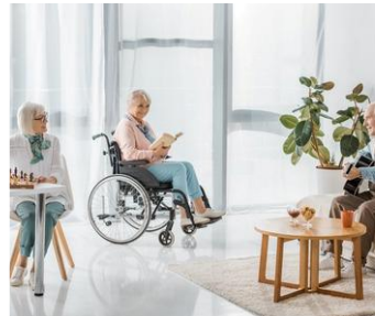
Résidence Lavoir Rue du Presbytère